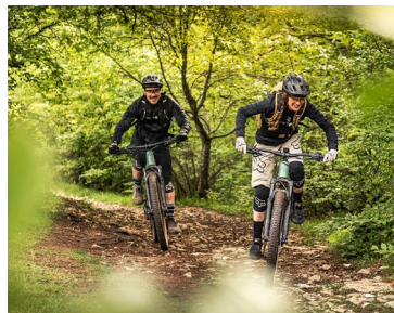
Sportlich mit dem Dienstrad in der Freizeit