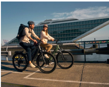
Mit dem Dienstrad unterwegs in der Stadt

Hinweis! Die Nutzungsrechte der Bilder gelten bis 12_2025.