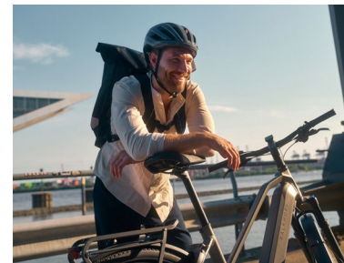
Das Dienstrad in urbaner Umgebung